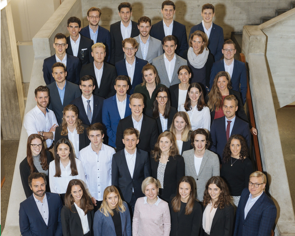
Studentenparlament der HSG, Student Parliament